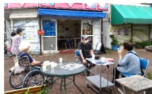
まったり木曜臨時立ち寄り所

コロナの影響で人間関係が断たれ、家の中に籠っているうちに足腰が衰え、免疫力の低下も懸念されます。友人や隣人に相談しにくい雰囲気の中、弱い立場の人たちにとってのSOSを受け止める地域の窓口が必要です。北二福進協の「まったり木曜臨時立ち寄り所」とタイアップし、毎週木曜日に「ともに相談」として、相談窓口を開設しています。